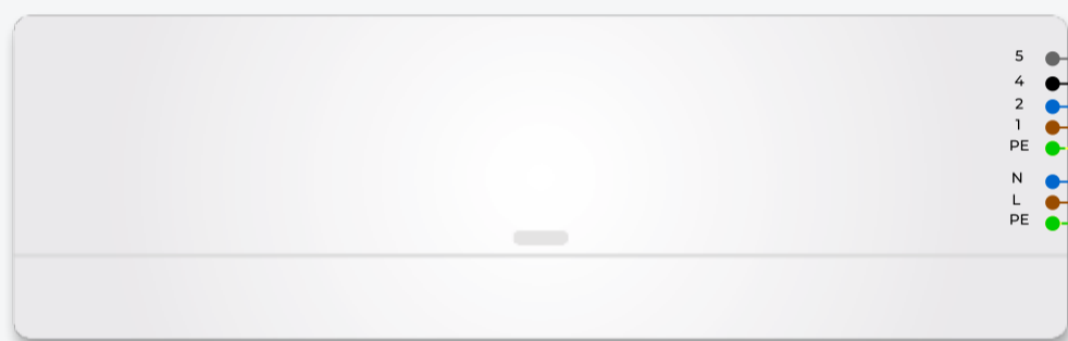
Кондиционер внутренний блок

В зависимости от производительности кондиционера, межблочный кабель может быть сечением как 1.5 мм.кв., так и 2.5 мм. кв.